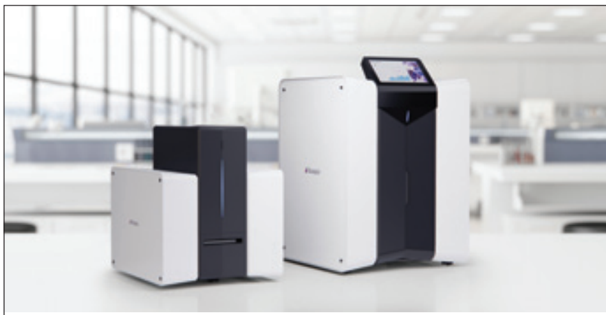
Obr. 2. Dvě kapacitní varianty zařízení Scpio, laskavostí firmy Beckman Coulter.